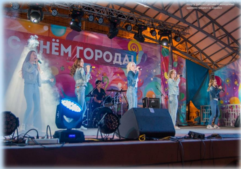
Комитет по культуре, физической культуре, спорту, работе с детьми и молодежью администрации г.о. Зарайск