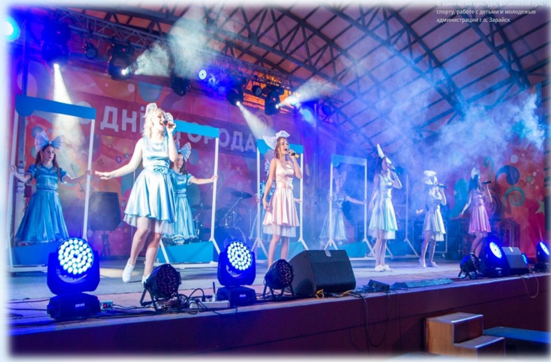
Комитет по культуре, физической культуре, спорту, работе с детьми и молодежью администрации г.о. Зарайск