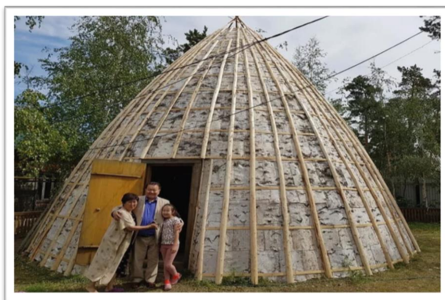
Слайд Летнее жилище «Урасе»