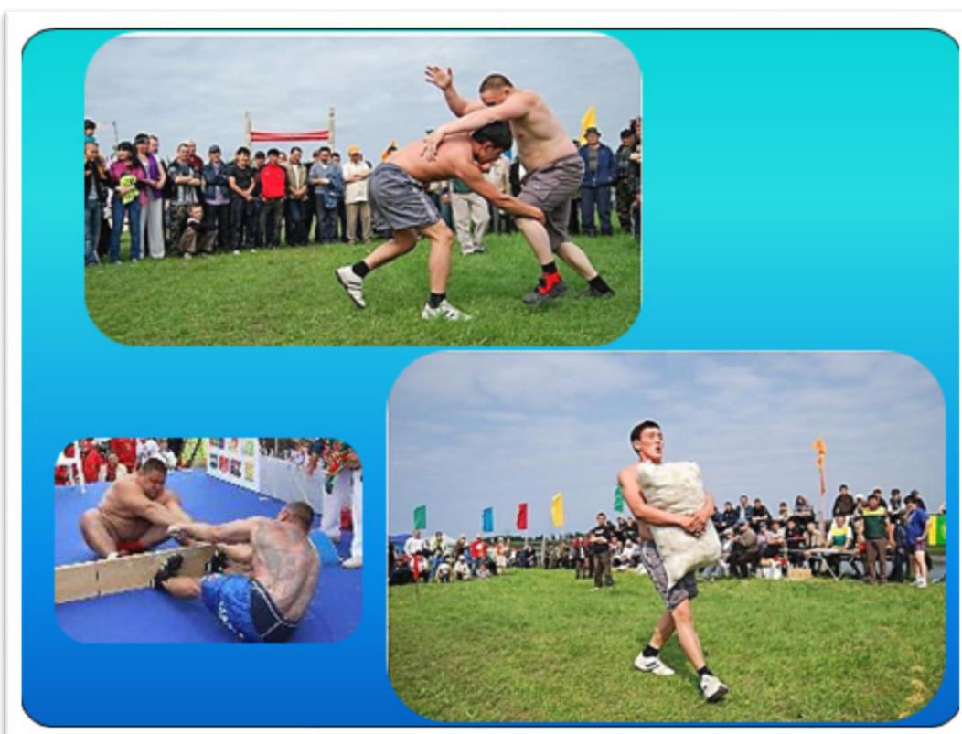
Национальный праздник «Ысыях»