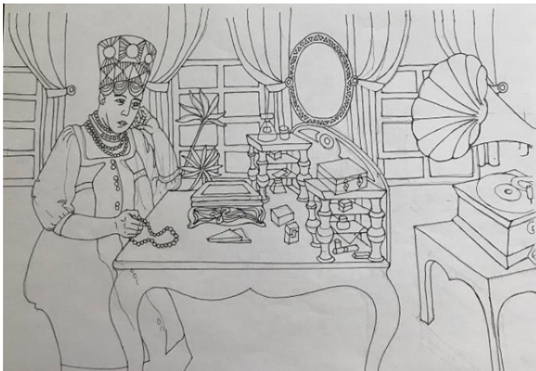
Рис. 1. Барыня – один из персонажей мультфильма