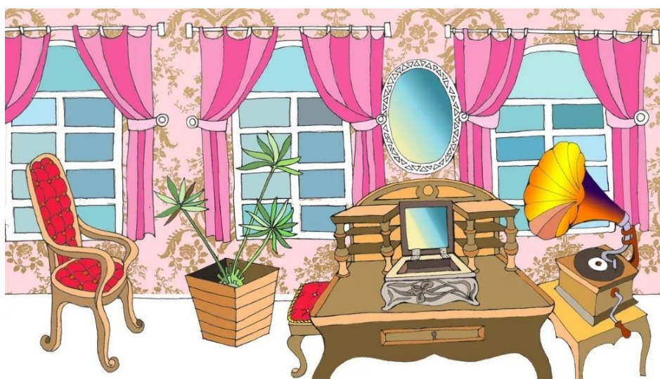
Рис. 2. Фоновый рисунок комнаты

То, что мультфильм создается в стенах православной образовательной организации, является значимым преимуществом, поскольку над ним трудятся специалисты в сфере теологии, компетентные в вопросах вероучения и нравственного богословия. А рисунки, являющиеся основой для иллюстраций и кадров конечного продукта, пишутся студентами-иконописцами, которые