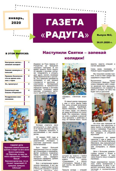
Рисунок 1 – Газета «Радуга»

Одной из постоянных рубрик газеты (рисунок 1) является рубрика «Семейные традиции».