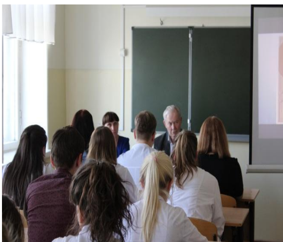
Встреча - «Жизненный подвиг В.А.Некипелова»

Организация гражданско – патриотического воспитания студентов – это путь к духовному возрождению социального общества, будущих поколений страны, восстановлению величия нашего Отечества.