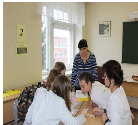
Исторический квест «Герои Сталинграда».